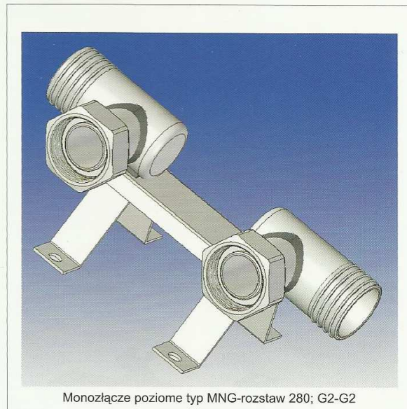
Monozłącze poziome typ MNG-rozstaw 280; G2-G2